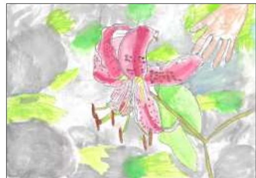
きらり賞 「あまい におい」