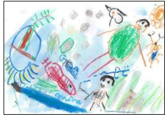
いろどり賞 「ピオトープ、たのしいな」