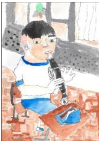
のびのび賞 「はじめてのリコーダー」