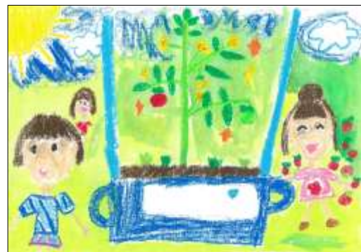
わくわく賞 「きれいに そだってね」