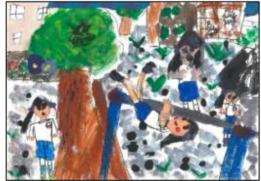
のびのび賞 「鉄ぼうは楽しいな」