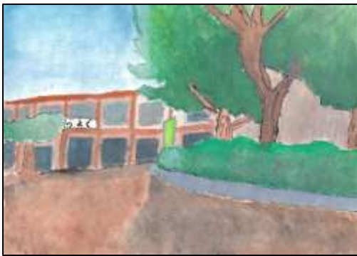
きらり賞 「校庭の隅に僕の思い出」