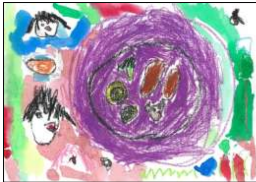
インパクト賞 「遠足のお弁当」