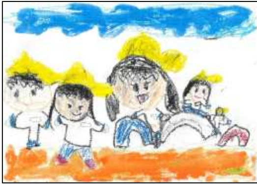
スマイル賞 「たいやとび」