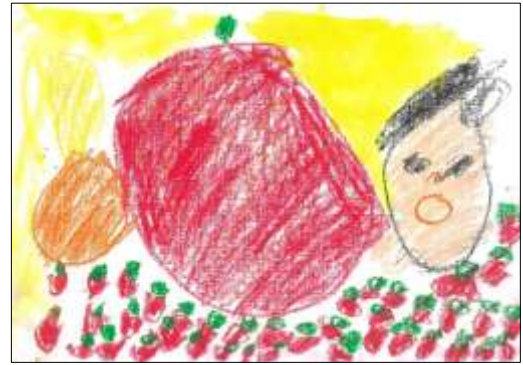
インパクト賞 「大すきなイチゴ」