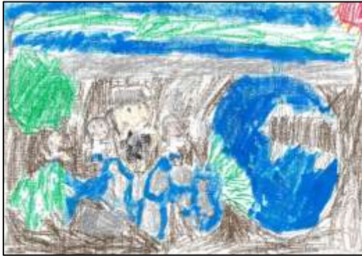
のびのび賞 「たのしいピオトープ」