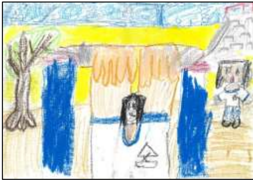
のびのび賞 「てつぼう がんばるぞ」