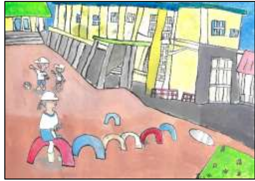
スマイル賞 「6年校舎とタイヤ跳び」