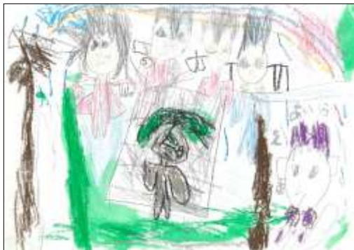
のびのび賞 「ピオトープで遊んだよ」