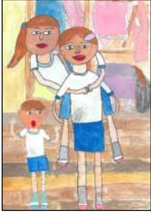
スマイル賞 「重くないよ」